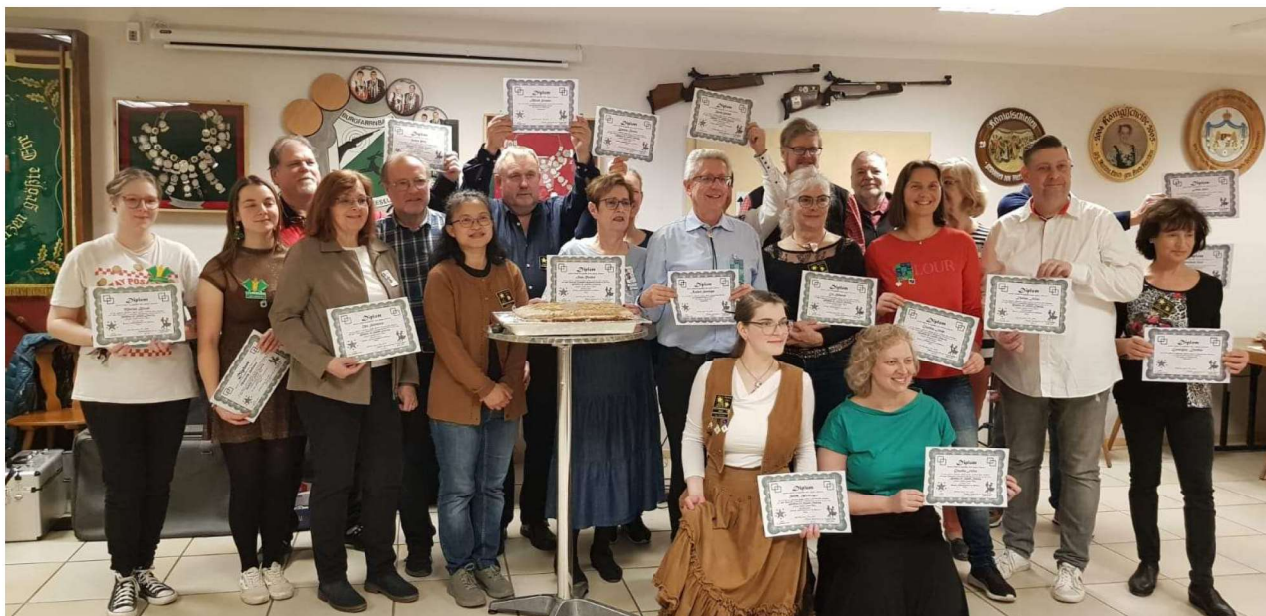
Bild zeigt die ganze Class mit insgesamt 11 Students und 9 Wiederholern.

Am 17.12. haben 9 Shillelaghs erfolgreich ihre PlusGraduation bestanden.