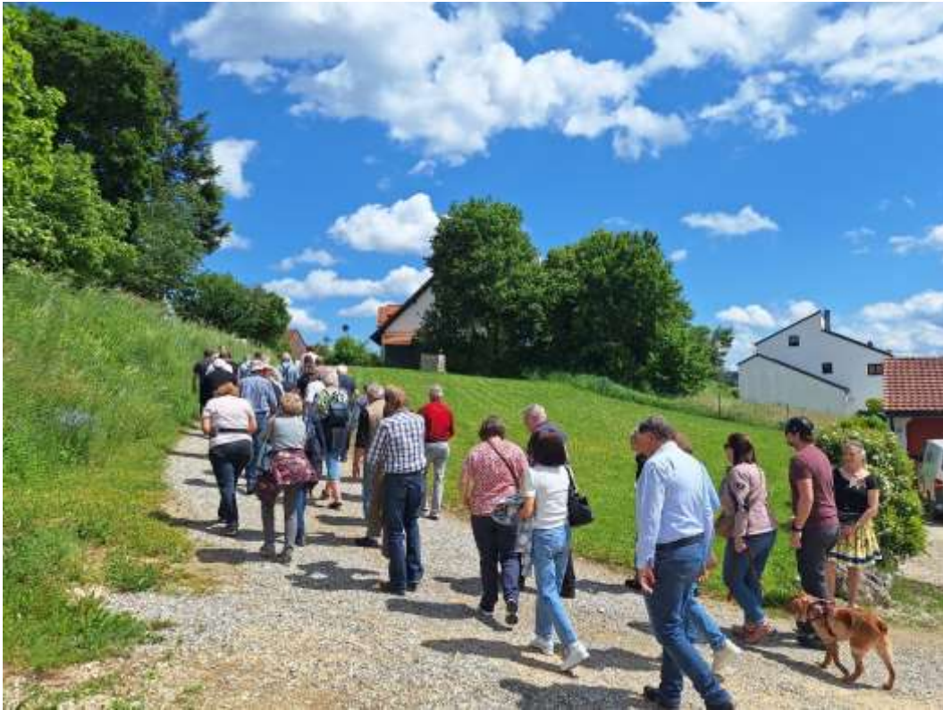
Ein kurzer Spaziergang bei herrlichem Wetter....