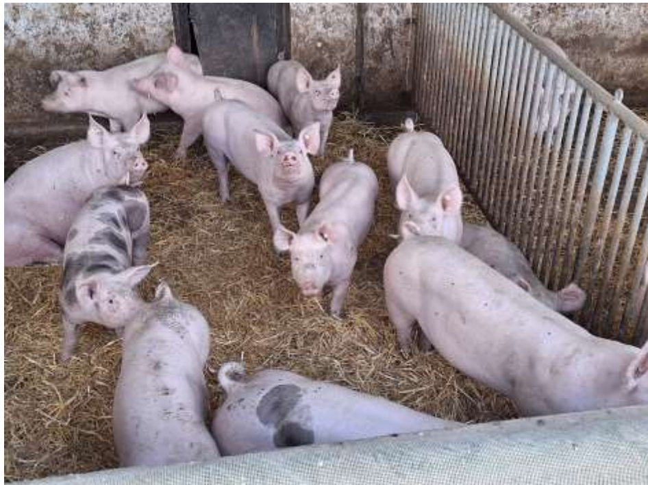
... von außen besichtigten wir den Betrieb mit Strohschweinestall. Dies ist Haltungsform 4 Premium im Supermarkt